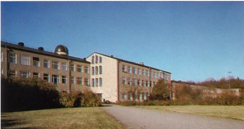
Nya Elementars Gymnasium i Åkeshov

Från och med läsåret 1973-74 förlades hela utbildningen i Stockholm till nyinredda lokaler i Nya Elementars Gymnasium i Åkeshov, men organisatoriskt tillhörde utbildningen fortfarande Polhemsgymnasiet. Anledningen var att Nya Elementars Gymnasium vid denna tidpunkt endast hade teoretiska linjer.